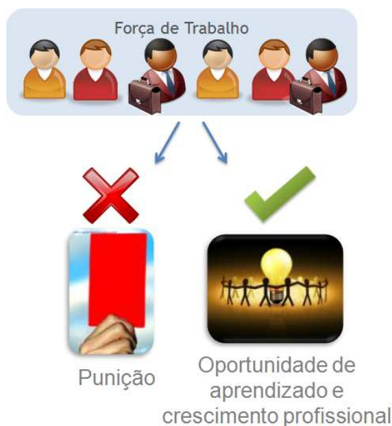
Figura 4 – Mecanismos de Reconhecimento.

Em seguida, estão listadas algumas sugestões de ações para definição de uma estrutura de reconhecimento na organização