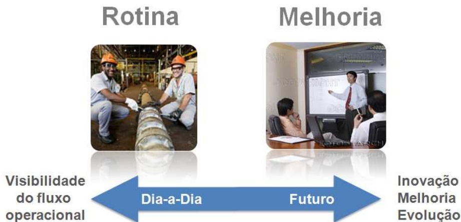
Figura 2: Objetivos da Governança de Processos.

As alternativas de objetivo do Modelo de Governança variam: atuando no dia a dia, age-se na rotina da produção e dos processos, criando uma visibilidade do fluxo operacional; já em um horizonte de tempo no futuro, age-se com inovação, buscando a melhoria e evolução dos processos.